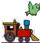
Kereta Api I

Dua buah kereta api bergerak bersamaan dengan arah berlawanan. Jarak kedua kereta api 100 km. Kereta api I melaju dengan kecepatan 15 km/jam, sedang kereta api II dengan kecepatan 35 km/jam. Pada saat yang bersamaan pula, terbang seekor burung dengan kecepatan 45 km/jam. Andaikan bila burung tersebut mula-mula terbang dari kereta api I sepanjang lintasan kereta api, lalu pada saat bertemu dengan kereta api II kembali berbalik arah menuju kereta api I, dan saat bertemu kereta api I kembali berbalik menuju kereta api II, demikian seterusnya hingga kedua kereta api bertemu, maka berapa total jarak yang ditempuh burung?